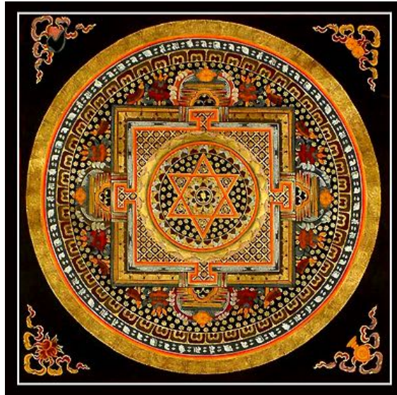
Tibetaanse mandela, bestaande uit cirkelpatronen

loze [ten volle] worden geopenbaard. ” De traditionele versie geeft geen aansluiting bij andere bijbelverzen in het Oude- noch Nieuwe Testament en dat op zichzelf is al reden tot twijfel. Mijn versie volgt ook logisch op het voorgaande vers: “Wat hem thans weerhoudt weet u.” Er staat niet ‘wie’ maar ‘wat’. In de korte periode die aan Christus’ wederkomst voorafgaat worden de zegels van Openbaring 6 verbroken. Dat houdt in dat pas als het Vrederijk nabij is de Antichrist zal worden ontketend. Het ‘niet nabij zijn van het komende rijk’ is wat hem tegenhoudt! Vervolgens, als dat Vrederijk daadwerkelijk aanbreekt zal hij weer worden geketend. Dit past bij de boodschap van 26 januari 2014 uit het Boek der Waarheid: “Waarom is dit zo? Waarom hebben deze veranderingen plaatsgevonden en waarom zo plotseling? Het antwoord is ‘tijd’ – want de tijd is kort.”